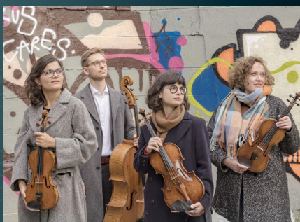
CHAOS STRING QUARTET