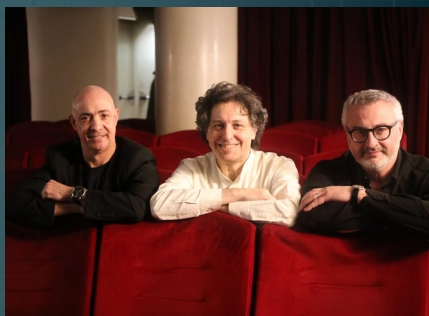
CLASSIC & JAZZ